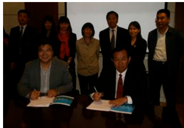
高校与国家外国专家局培训中心签署战略合作协议