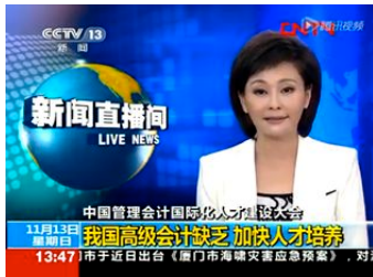
中央电视台报导我国高级会计缺乏,加快人才培养

在国际上,作为美国 COSO 委员会的创始成员及国际会计师联合会(IFAC)的主要成员,IMA 在管理会计、公司内部规划与控制、风险管理等领域均参与到全球最前沿实践。此外,IMA 还在美国财务会计准则委员会(FASB)和美国证券交易委员会(SEC)等组织中起到非常重要的作用。IMA 拥有一系列的工具和资源可以提升个人职业技能、激发个人职业潜能、甚至优化企业整体绩效。IMA 通过旗下备受全球 CFO 推崇的注册管理会计师(CMA)资格认证、高端会员人脉网络、继续教育课程、以及高标准职业道德规范实践,为 IMA 会员搭建一个资源丰富、充满活力的发展和社交平台,从而推动会员的职业生涯发展。